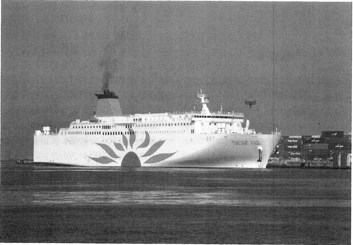
大阪南港～志布志(鹿児島)を結ぶ(株)フェリーさんふらわあの新鋭船「さんふらわあさつま」

長距離フェリー創設50年の記念の年に、ぜひ、長距離フェリーの船旅をお楽しみいただきたい。