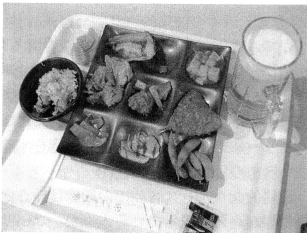
瀬戸内海航路の新鋭船「フェリーおおさかⅡ」の夕食バイキングの多彩な料理