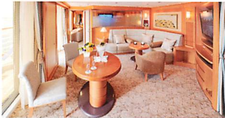
グランドスイート