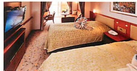
ジュニアスイート