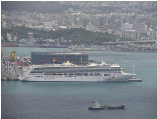
⑥那覇港では「スーパースター・ヴァーゴ」がコンテナ埠頭に着岸していました。