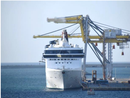
⑪会議が終わってホテルに入ると、ベランダから「スーパー・スター・ヴァーゴ」の姿が正面から見えました。