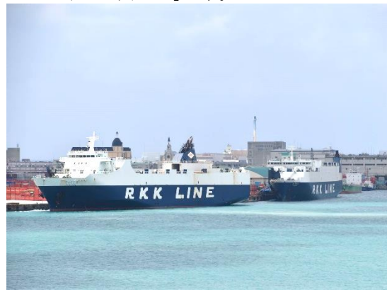
⑩安謝港の RORO 船埠頭に着く、琉球海運の 2 隻の RORO 船の姿です。