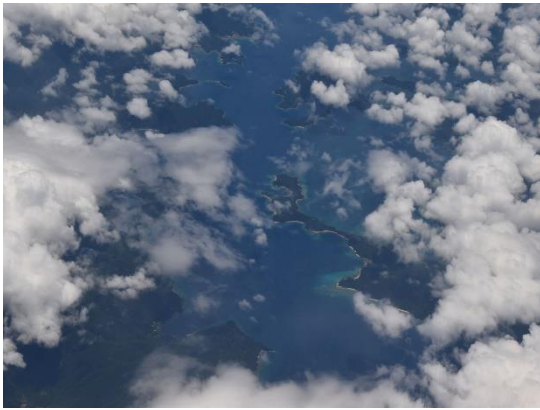
①奄美大島の南端の海峡がちらりと見えました。

行きの飛行機からは、2月にフェリーによるアイランドホッピングツアーをした奄美群島が、雲は多少ありましたが、順番にきれいに見ることができました。