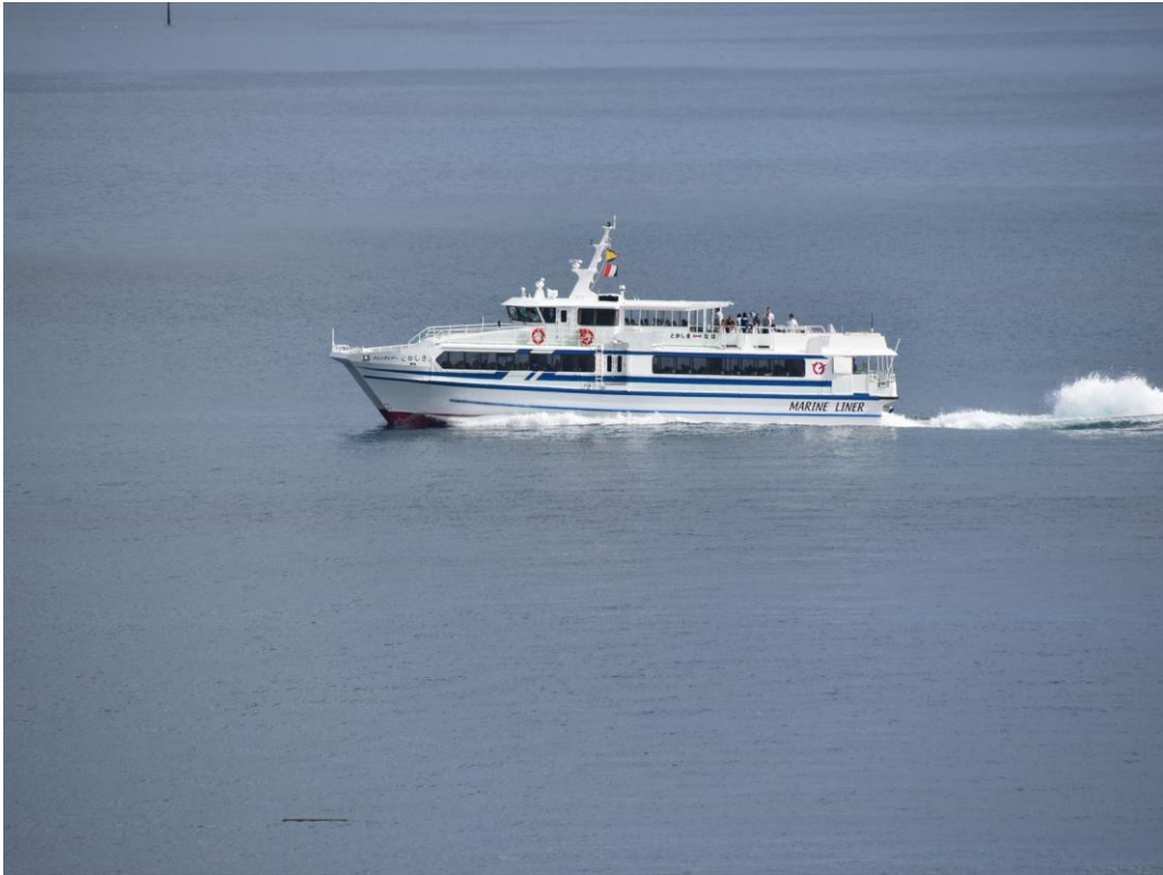
⑩9 時頃には、近隣の離島に向かう高速船が泊港から出港して、ホテルの前を通過していきます。「マリンライナーとかしき」です。