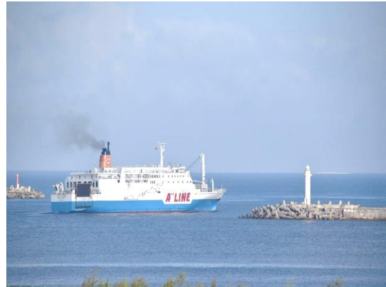
⑭翌朝、7時に那覇港を出港するマルエーフェリーの「フェリーあけぼの」の姿を見送りました。