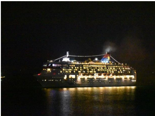
⑬懇親会が終わってホテルに戻ったら、「スーパー・スター・ヴァーゴ」が出港していく姿が見えました。