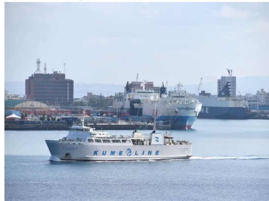
⑮8時半には、「ニューくめしま」が出港していきました。まだ、乗船したことがないので久米島航路には近々乗船したいと思っています。