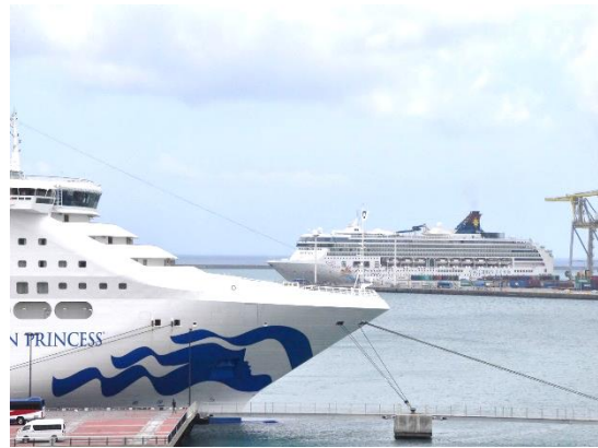
⑨泊大橋の上から撮影した「サン・プリンセス」と「スーパースター・ヴァーゴ」です。