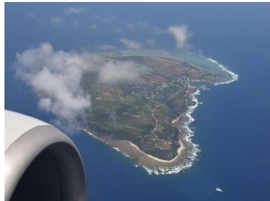
④与論島の上空で、那覇空港混雑のため30分ほど旋回して待機しました。