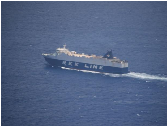
⑤着陸直前に琉球海運の RORO 船が北に向かって航行しているのが見えました。