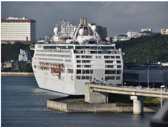
⑫同じくホテルからの「サン・プリンセス」の姿です。