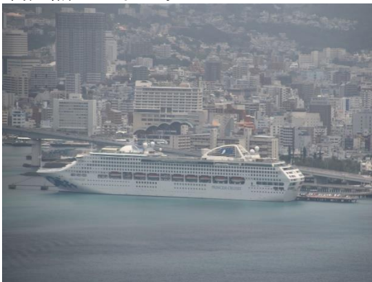
⑦クルーズターミナルには「サン・プリンセス」の姿がありました。2~3隻のクルーズ船が寄港することも多くなり、新しいクルーズ岸壁の計画が急がれています。