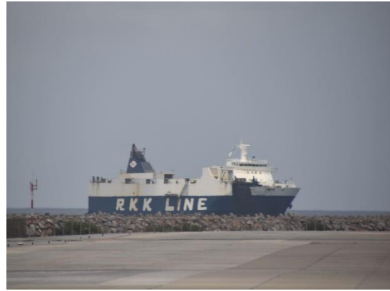
⑧滑走路を移動する途中で、窓から那覇港に入港する琉球海運の RORO 船が見えました。