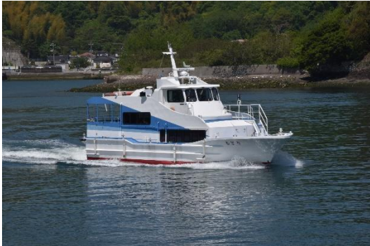
高速旅客船「ちぎり」は、竹原港と契島を結びます。