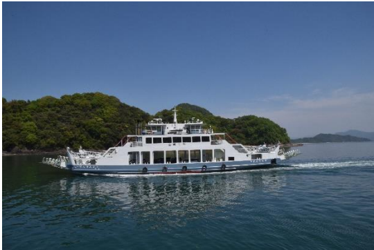
竹原港に入港する「第七さんよう」の姿です。