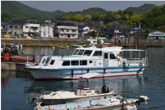
大久野島への純客船「マリンラビット」。ゴールデンウィークで乗客が溢れていて、3時間待ちとか。