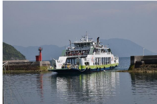
フェリー「第三おおしま」。大崎上島とを結びます。