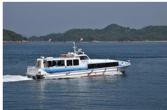
須波港をでて大久野島に向かう高速旅客船「かがやき1号」もキャッチできました。

須波港に到着した時に、ちょうど生口島航路の「第七かんおん」が入港してきたので、短い船旅を楽しむことにしました。ずっと車での移動だったので、海風を浴びながらの船旅が爽快でした。わずか25分の航海ですが・・・。