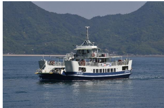
生口島の沢港との間のフェリー「第七かんおん」は25分の航海時間です。