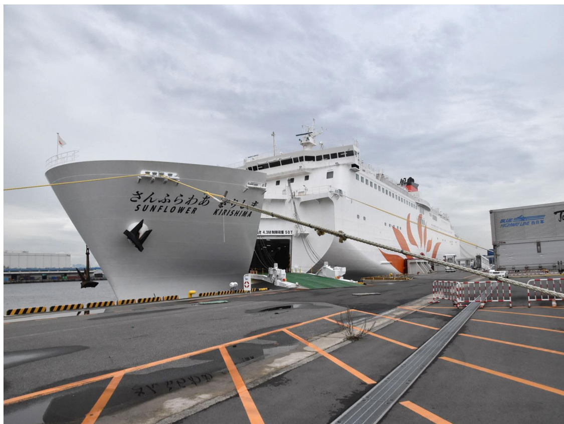
大阪南港に停泊する「さんふらわあきりしま」

1月の連休(1月11日大阪南港発、14日大阪南港着)を利用して、新造船2隻の船上での本学会主催の新年会を企画中です。鹿児島での船三昧ツアーの第2弾です。ぜひご予定ください。