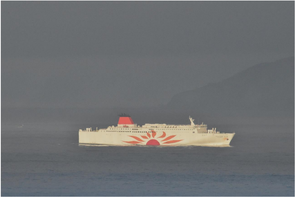
早朝に紀淡海峡を北上する「さんふらわあさつま」の姿です。背景の山は淡路島の南端です。