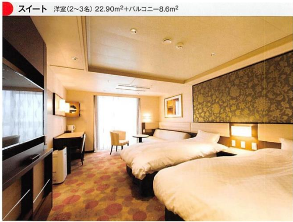
スイート 洋室(2~3名) 22.90m 2 +バルコニー-8.6m 2

設備 ベッド(幅103cm)・専用バルコニー・バス・トイレ・洗面台・テレビ・冷蔵庫・電気ケトル・ドライヤー・空気清浄機・スリッパ 備品 シャンプー・コンディショナー・ボディソープ・バスタオル・フェイスタオル・歯ブラシ・カミソリ・くし・コットンセット・ミネラルウォーター(ペットボトル)・コップ・ナイトウェア・ハンガー・お茶・コーヒー・紅茶