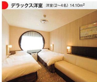
デラックス洋室 洋室(2~4名) 14.10m 2

設備 ベッド(幅92cm)・シャワー・トイレ・洗面台・テレビ・冷蔵庫・電気ケトル・ドライヤー・空気清浄機・スリッパ 備品 シャンプー・コンディショナー・ボディソープ・バスタオル・フェイスタオル・歯ブラシ・カミソリ・くし・コットンセット・ミネラルウォーター(ペットボトル)・コップ・ナイトウェア・ハンガー・お茶・コーヒー・紅茶