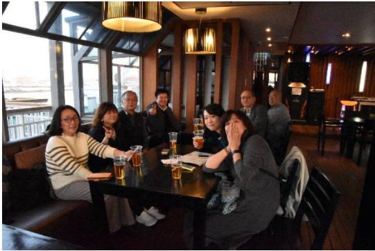
展望ラウンジ「夢」での出港前パーティです。ハッピーアワーはビールが1杯300円。