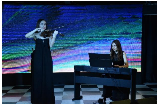
食事の後はショータイム