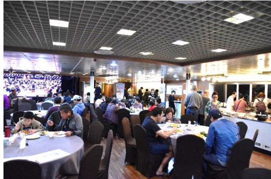
レストランでの夕食風景