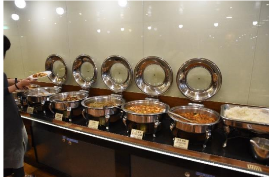
食事はバイキング式で、韓国料理、中国料理などが並びます。