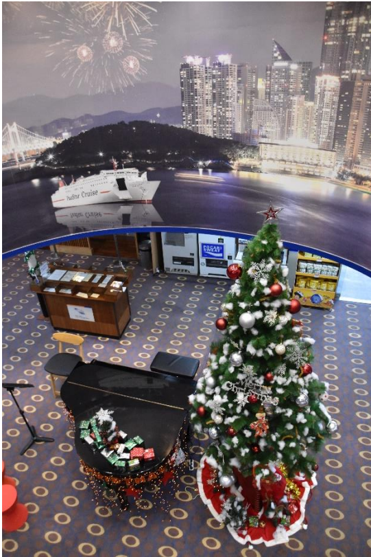
船内はすっかりクリスマスの装いでした。2階の吹き抜けからロビーを見下ろした写真です。