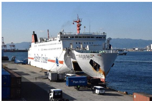
大阪南港の国際フェリーターミナルに着く「パンスタードリーム」

その後、「夢」に移って船談義は続きました。22時少し前には瀬戸大橋を通過しました。