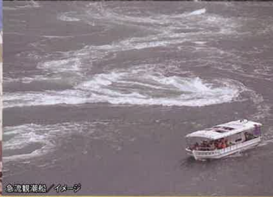
急流観潮船 イメージ