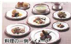
料理の一例 イメージ