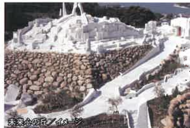
未来心の丘 イメージ