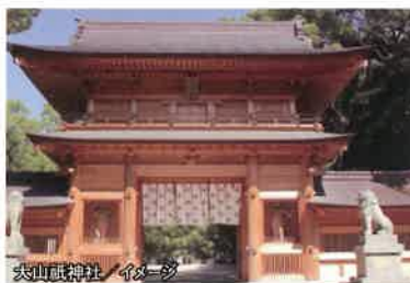
大山祇神社 イメージ

船としての誕生を祝い、これからの航海の無事を祈る「進水式」は、船が出来上がるまでの工程において最も華やかな式典です。船が進水するとき、古くから様々な儀式が行われてきましたが、現在ではシャンパンの瓶を割るのを合図に進水する方法が一般的となっています。しまなみ造船では、伝統的な「船台」からの進水式を現在も行っています。船が初めて海に浮かぶ瞬間、合図とともに船台から船が滑り降り、進水するダイナミックな光景は圧巻です。