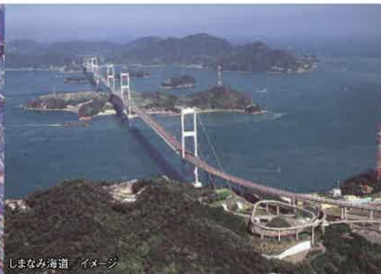
しまなみ海道 イメージ