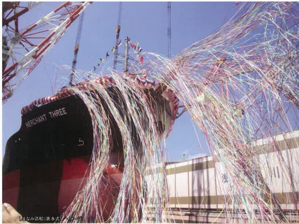
しまなみ造船(進水式) イメージ