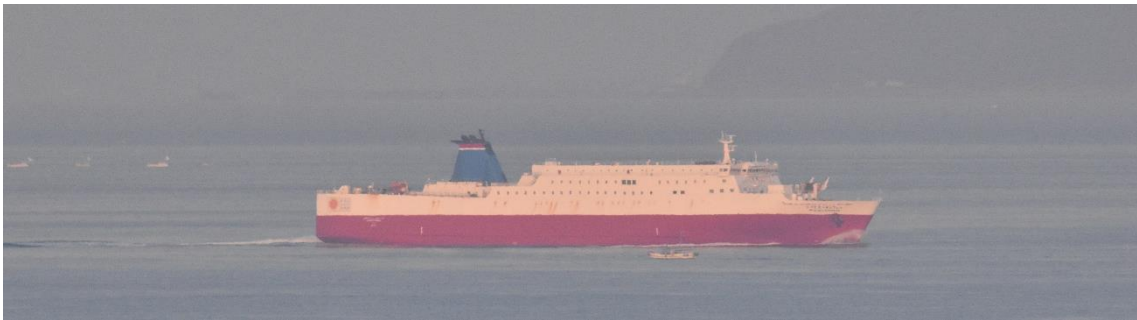
みやざきエクスプレス

コロナウィルス禍で自宅で過ごすように求められていることもあり、紀淡海峡が目の前の自宅でシップウォッチングを楽しんでいます。大阪湾、瀬戸内海に入る船を 600mm の望遠レンズで撮影した写真をご紹介します。2020 年 4 月 24～25 日の早朝の通過船のうち、フェリーと RORO 船です。フェリーのうち宮崎カーフェリーの船は毎朝 5 時半頃に、フェリーさんふらわあの船は 6 時少し前に姿を現します。