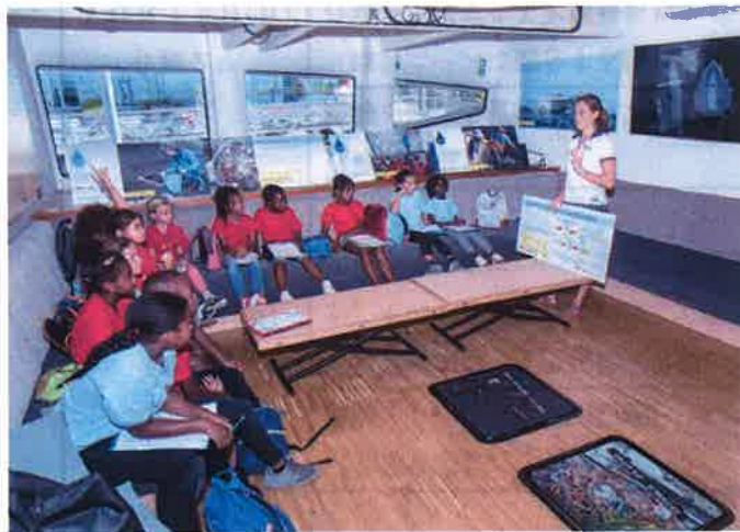
カリブ諸島での教室 2018年1月16日