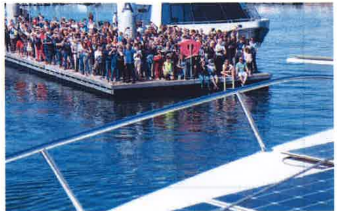
ロリアン港からレース・フォー・ウォーターが出港、2017年4月2日

航海途中ではそれぞれの海域のプラスチック汚染の実態のデータを収集し、海洋生物調査が科学者によって実施されます。また、各停泊地では、子供たちへの環境教育を目的としたイベントや市民との交流、シンポジウムなどを開催します。