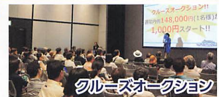
クルーズオークション

船会社以外にも多彩なブース(予定) アメリカン航空 ANA カタール航空 エイチ・エス損害保険 オーダースーツ "SuitYa"