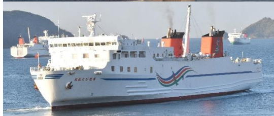
朝の八幡浜港では 3 隻のフェリーのシフトが行われていました。