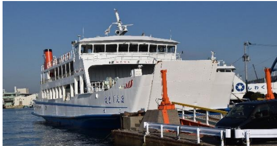
本島汽船のカーフェリー「ほんじま丸」。