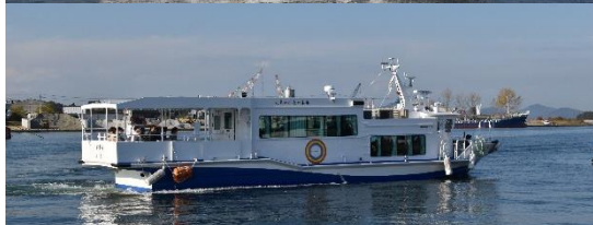
新造客船「にじまる」です。