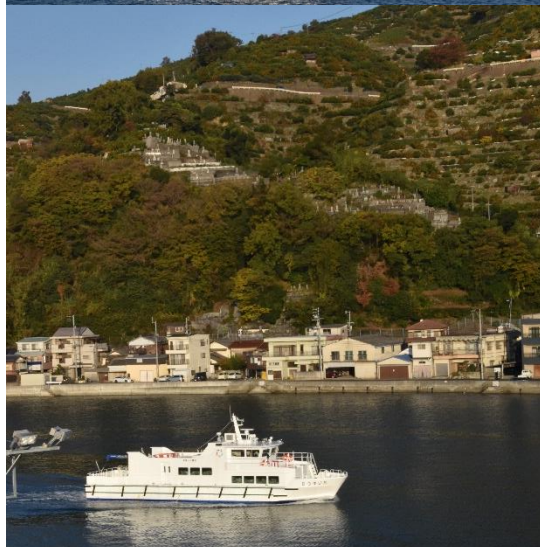
新造船「たいゆう 8」。背景の段々畑にはオレンジ色のミカンがたくさんなっていました。