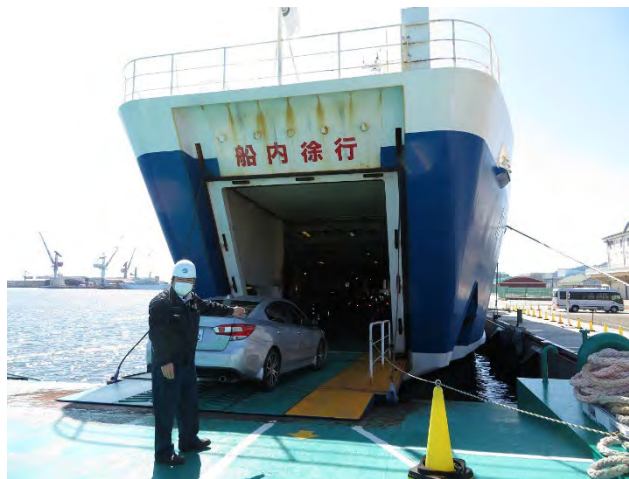
間口は狭いけど乗用車レーン3列 観光バスも2台搭載