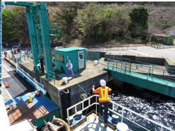
先輩と後輩の息がぴったり! で着岸