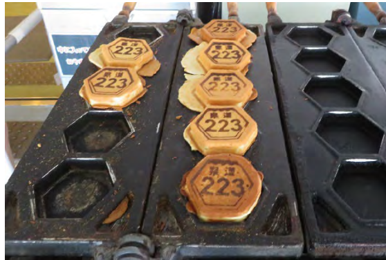
船尾にある名物屋台 たこ焼きと今川焼きが次々と売れて大忙し!