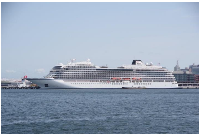
「VIKING ORION」 4月28日 新港ふ頭 横浜港初入港