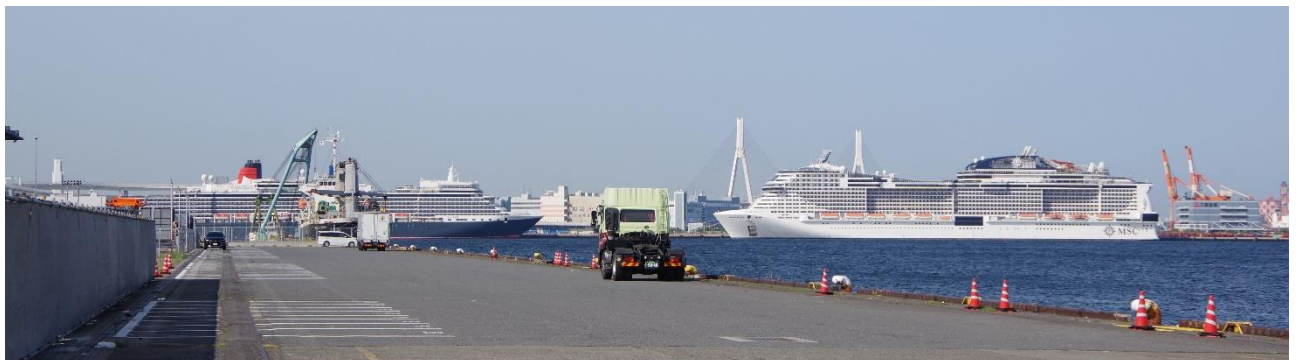
4月28日の大黒ふ頭 本牧ふ頭Aから QWEEN ELIZABETH と MSC BELLISSIMA