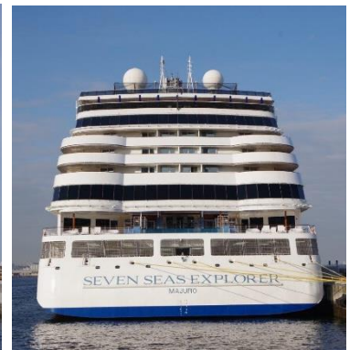
SEVEN SEAS EXPLORER