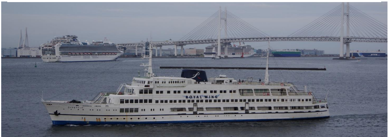
4月29日のロイヤルウィング と DIAMOND PRINCESS/MSB BELLISSIMA