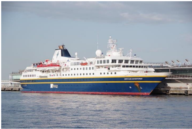
「HERITAGE ADVENTURER」 4月17日 大さん橋 横浜港初入港