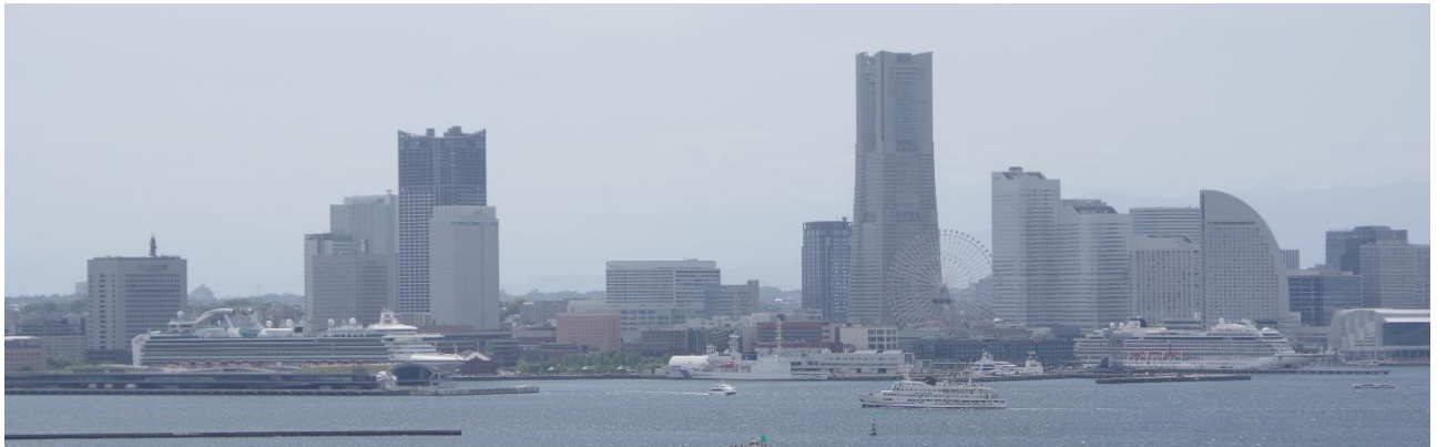
4月29日のみなとみらい方向 DIAMOND PRINCESS ロイヤルウィング VIKING ORION