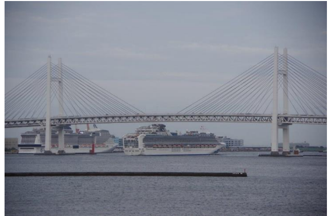
「DIAMOND PRINCESS」 4月29日 大さん橋 4月20日からベイブリッジをくぐって入れるようになりました