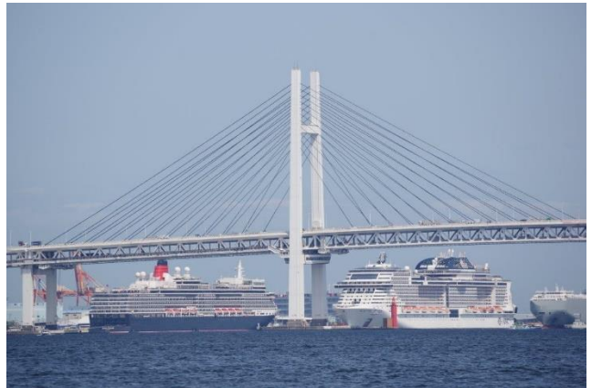
「MSC BELLISSIMA」 4月28/29日 大黒ふ頭 28日はQEと縦並び、29日はバースシフトして出船に変わりました ベイブリッジの北側橋脚にある横浜スカイウォークには土日祝に無料で入場できますが、28日（平日）の臨時開放は知りませんでした