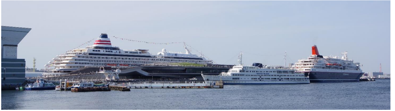
4月28日の大さん橋 飛鳥II ロイヤルウィング にっぽん丸