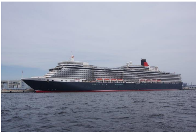
「QWEEN ELIZABETH」 4月19日 大黒ふ頭 本年初入港