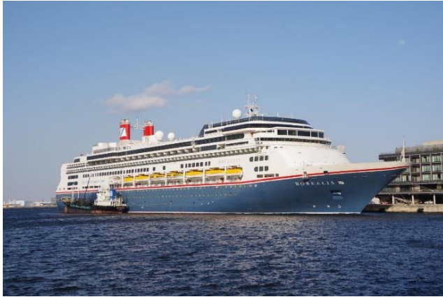
「BOREALIS」 4月3日 新港ふ頭 横浜港初入港