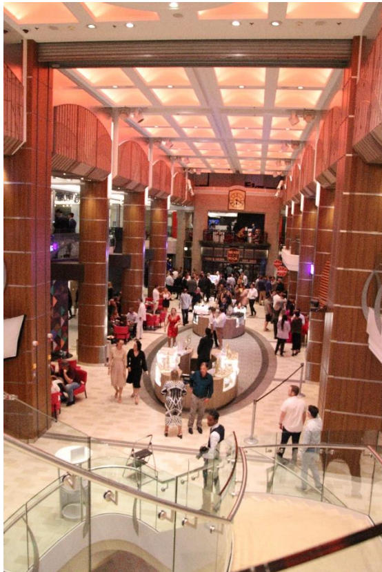
ソブリン、ボイジャー、オアシスクラスのような多層吹き抜けの空間はなくなり、他社のクルーズ客船のように2層吹き抜けのアーケードだけの造りです。