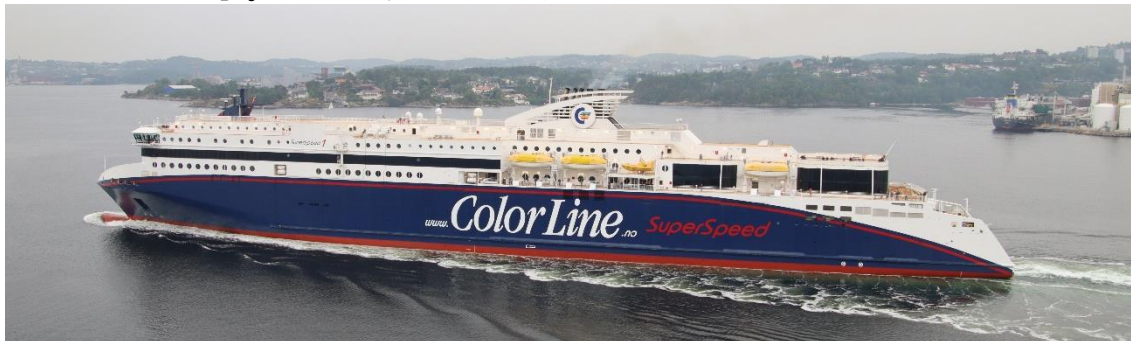
出港する「スーパースピード 1」です。