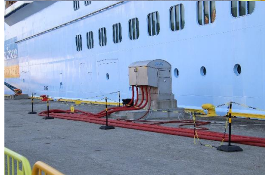
ノルウェーの港では陸上電源をとっていました。