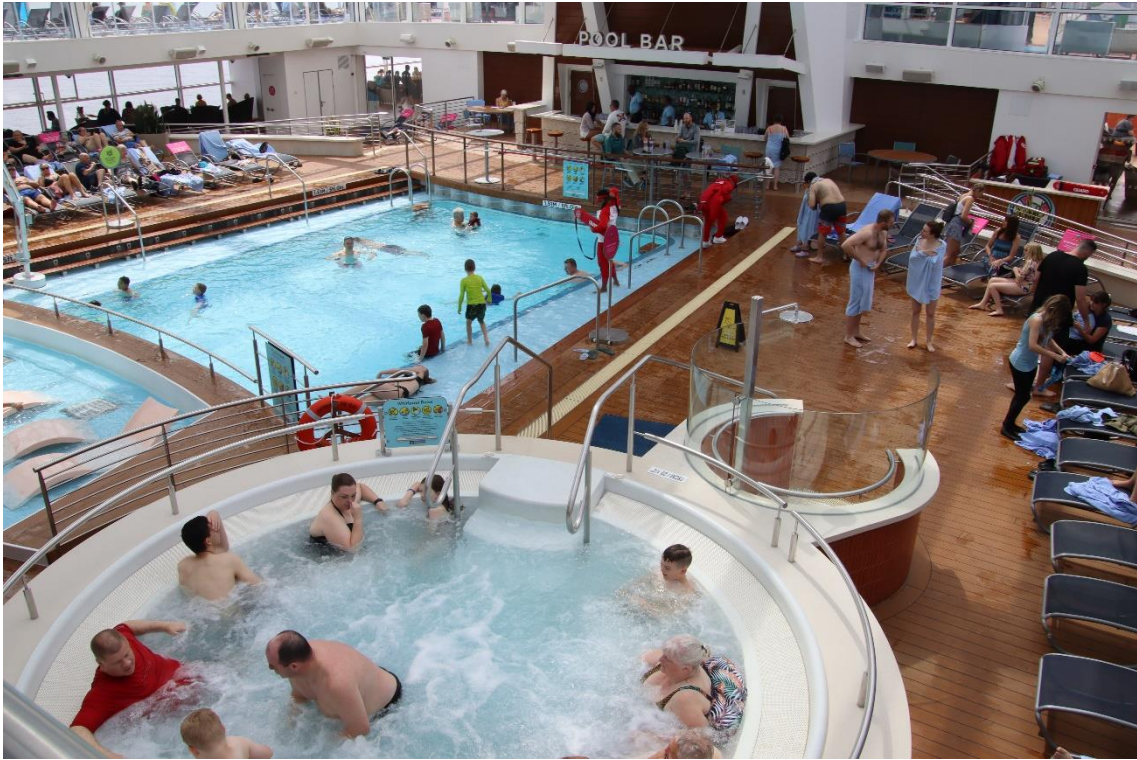
サンデッキの室内プールエリアです。