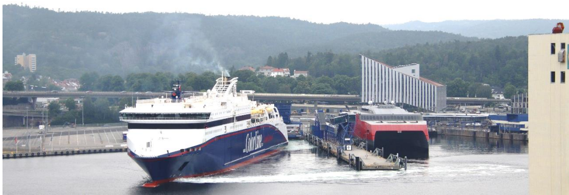
クリスチャンサンドのフェリーターミナルからカラーライン「スーパースピード 1」が出港する風景です。フィヨルドラインの「フィヨルド FSTR」(Fjord FSTR)が停泊しています。

それぞれのレストランのオープン時間も短くなっていました。スマホを使えば、瞬時に、どこがオープンしているかが確認できるので、効率的なレストランやバーの運用が可能となったということになります。例えばスマホのアプリの中の「Are you hungry?」というボタンを押せば、その時点で利用できるレストランが瞬時にわかります。ルームサービスは 24 時間いつでも可能となっていますが、原則有料なので船にとっては収入が増え、かつ 1 ヶ所で集中して調理、配達ができるので生産性は高いはず。乗客の利便性も向上して、人件費も減らせて、クルーズ客船の生産性はかなり上がっているように思います。利用者の満足感を上げて、かつ会社としての生産性を上げているのはさすがだと思います。