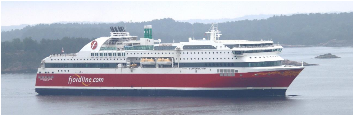
フィヨルドラインのカーフェリー「ベルゲンスフィヨルド」が入港してきました。この船とはベルゲンとスタバンガーでも出会いましたので3回目。よく活躍しているようです。