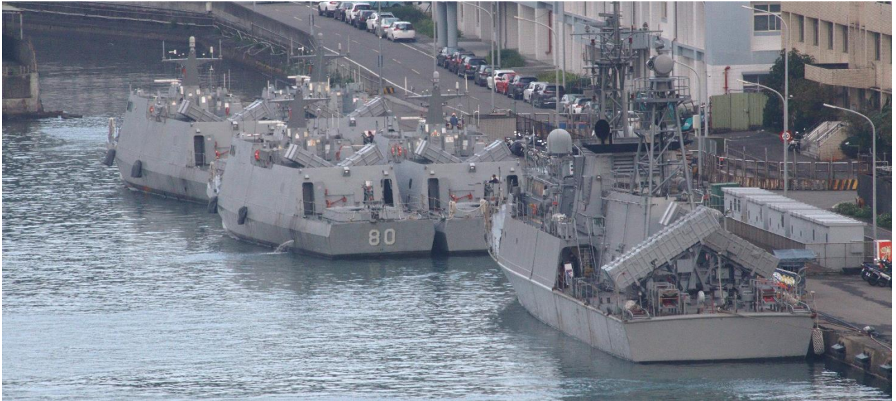
海軍基地に停泊する小型ミサイル艇群。MSC ベリッシマの船上からの撮影です。