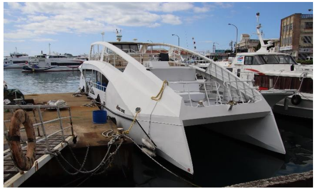
バッテリー船 vibes one