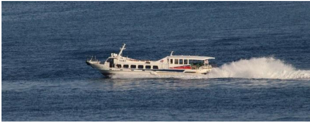
第 38 あんえい号