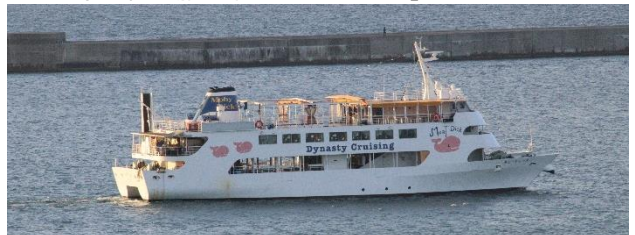
遊覧船「モビーディック」