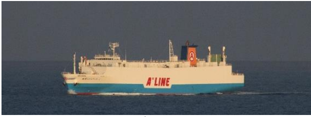
RORO 貨物船「琉球エクスプレス 2」