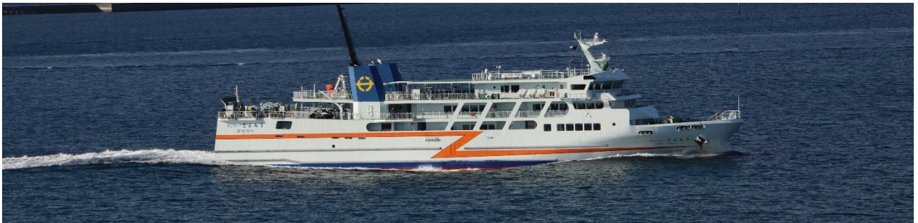
座間味島航路の「フェリーざまみ 3」