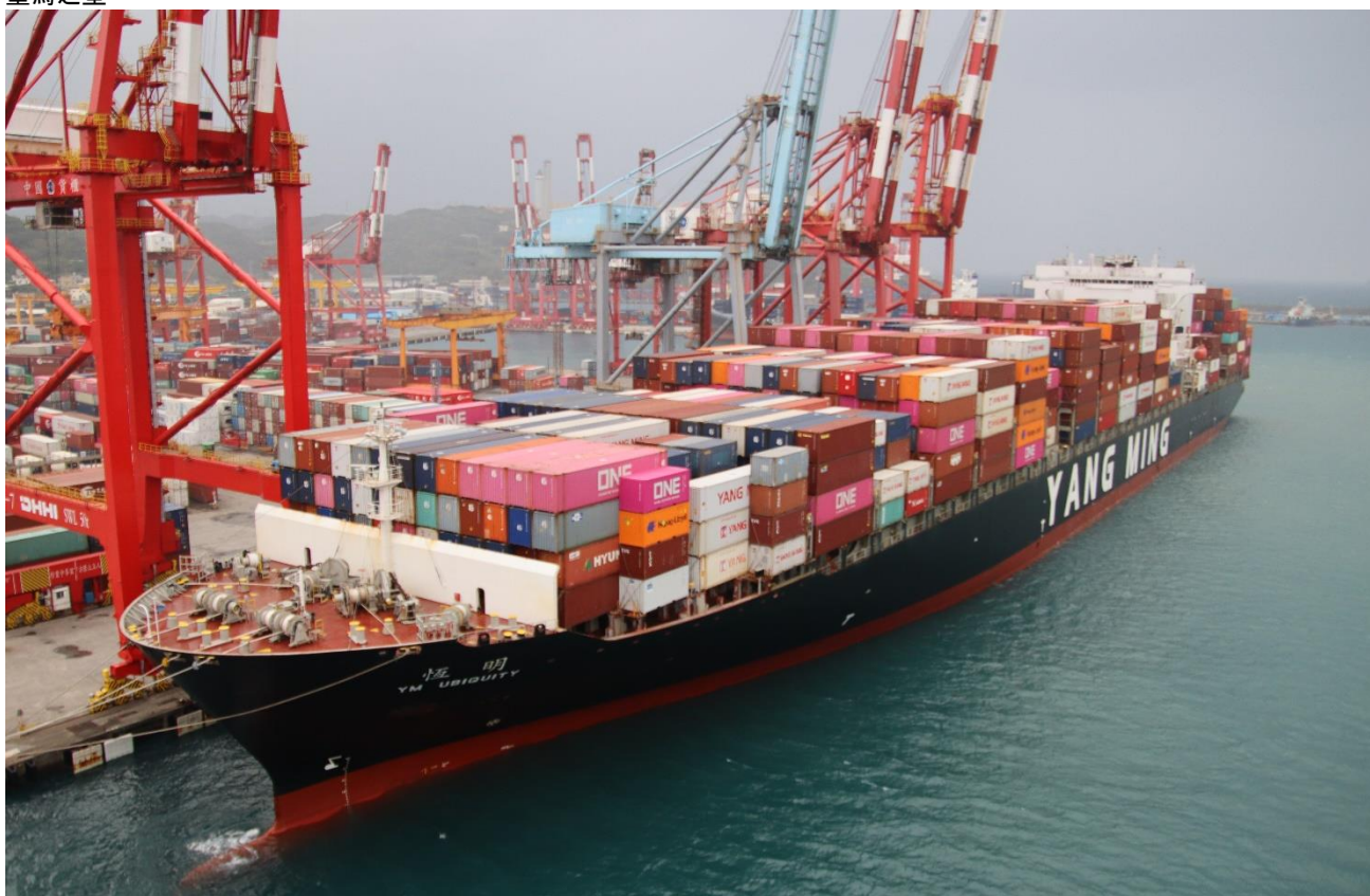
台湾の大手海運会社 Yang Ming のコンテナ船「YM Ubiquity」。煙突の両側にはスクラバーらしき巨大な構造物（後掲）が見えます。