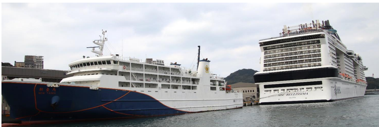
基隆港に停泊する「MSC ベリッシマ」と内航カーフェリー「新臺馬」が並びました。