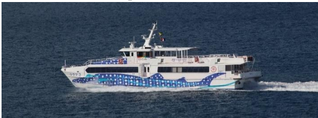
沖縄本島沿岸航路客船「タクマ 3」