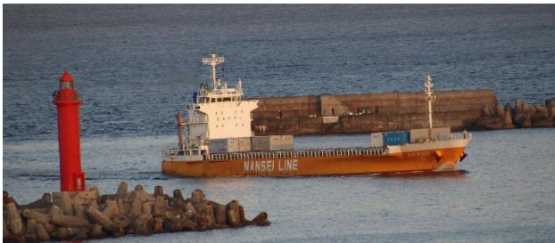
コンテナ船「なんせい丸」