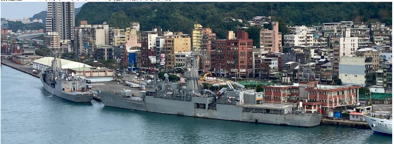
基隆港の東岸には台湾海軍の駆逐艦・フリゲート艦が並んで停泊していました。