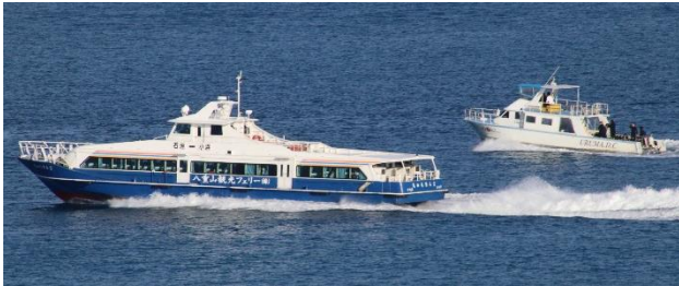
ちゅらさん 2 とダイビングポート(右)