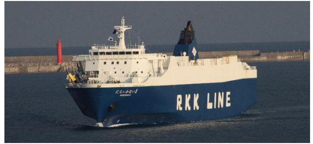
RORO 貨物船「にらいかない II」