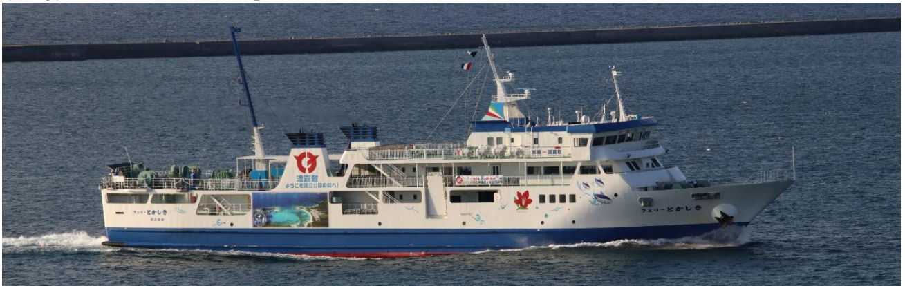
渡嘉敷島航路の「フェリーとかしき」