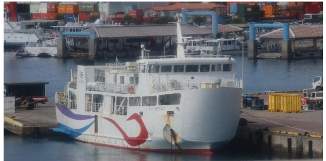
フェリーはてるま 2