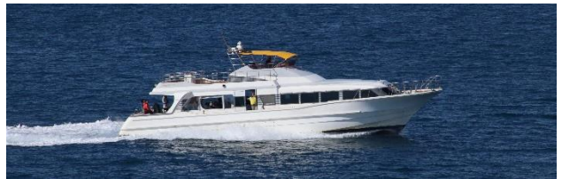
チャーター船(船名不明)