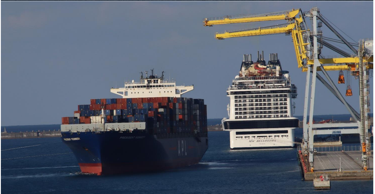
那覇新港第2クルーズターミナルに着岸時の姿です。上の写真はRORO貨物船「しゅれいⅡ」、下の2枚はAPLのコンテナ船「ブレジデント・ケネディ」とのツーショットです。