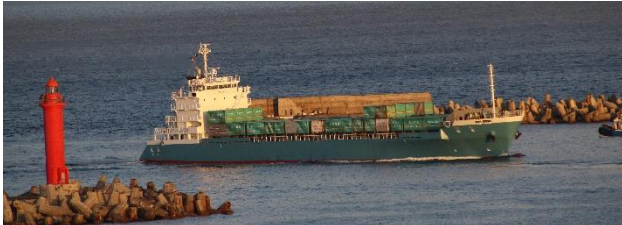
コンテナ船「島風」(しまかじ)