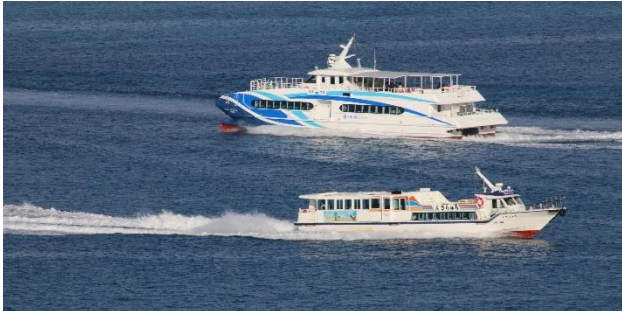
あやばに(上)とちゅらさん