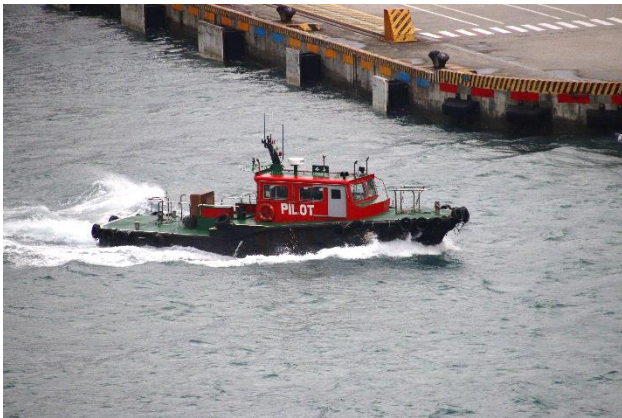
パイロットボート