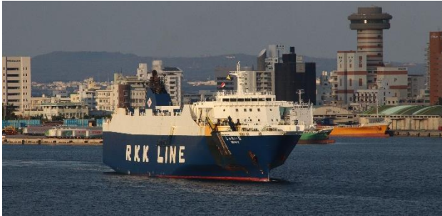
那覇港を出港する「しゅれい II」