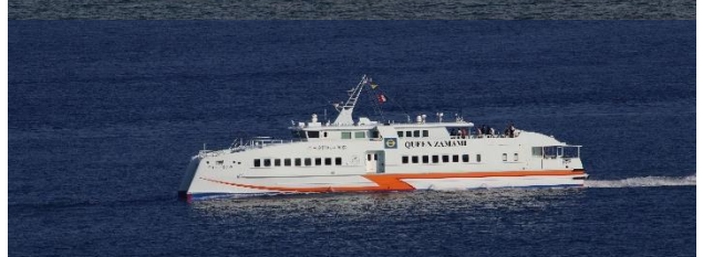
座間味航路高速旅客船「クイーンざまみ」