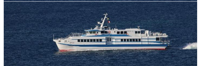
渡嘉敷航路高速旅客船「マリンライナーとかしき」