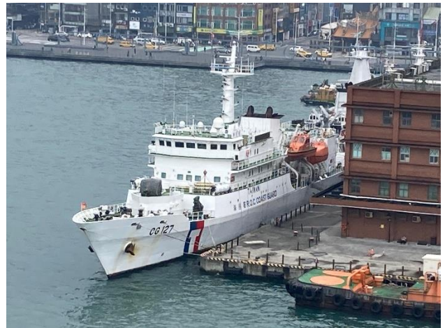
コーストガードの警備船