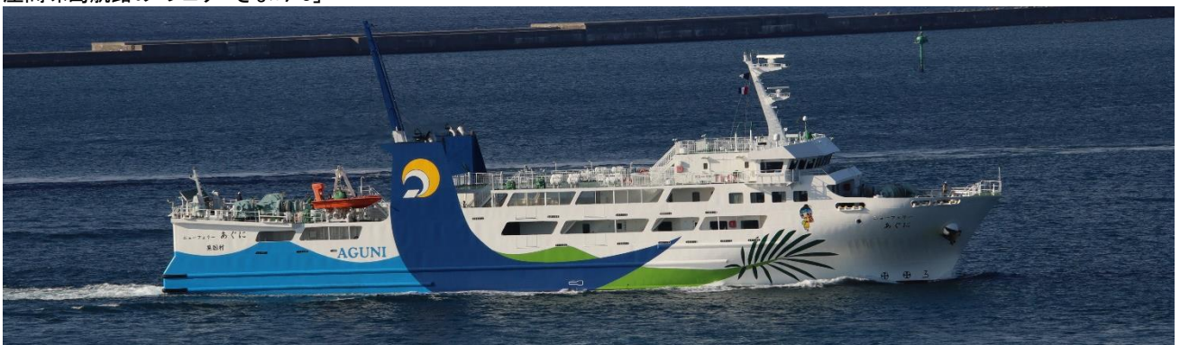
粟国島航路の「ニューフェリーあぐに」