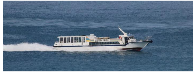
サザンパラダイス