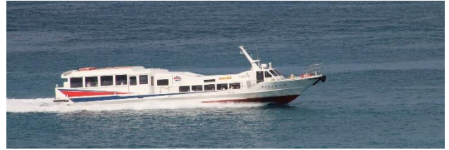
第 98 あんえい号