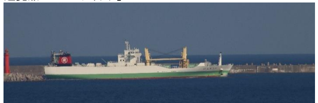
RORO/LOLO コンテナ船「うりずん 21」