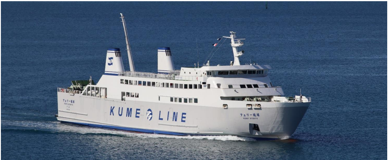
久米島航路の「フェリー琉球」