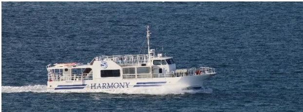
チャーター船「ハーモニー」