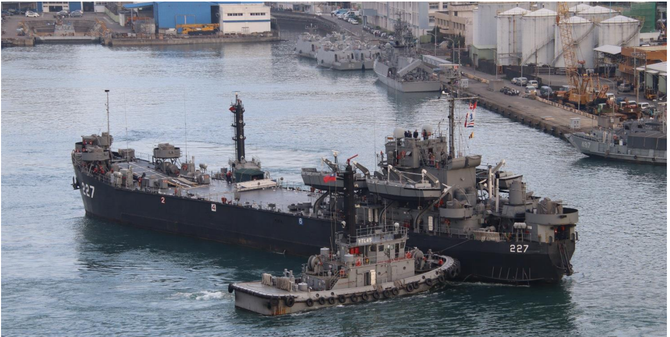
揚陸艦 227 が、海軍のタグボートの支援で離岸しました。