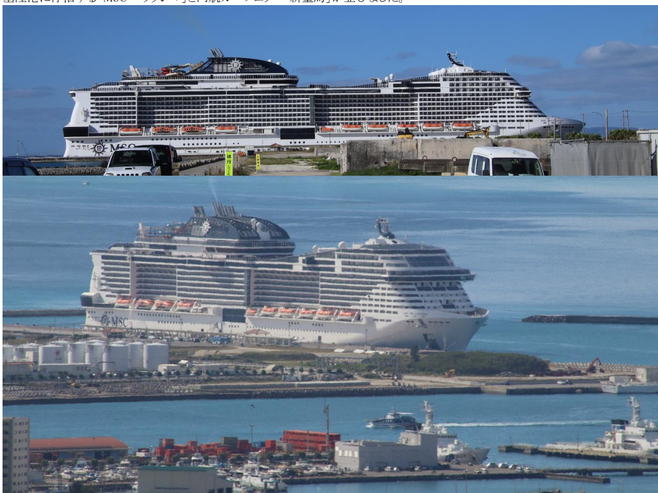
石垣島停泊時です。人工島の先端に建設されたクルーズ岸壁に着岸しました。