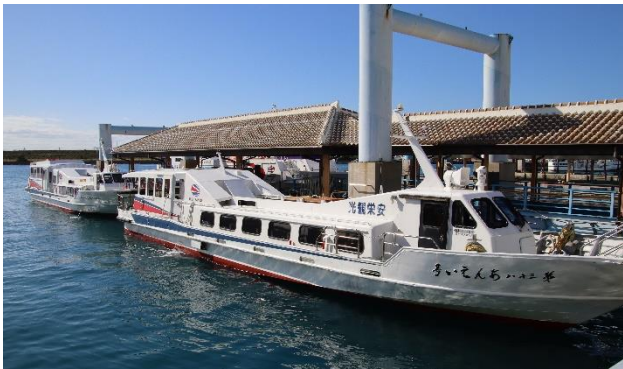
第 38 あんえい号