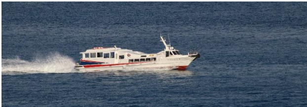
第 88 あんえい号