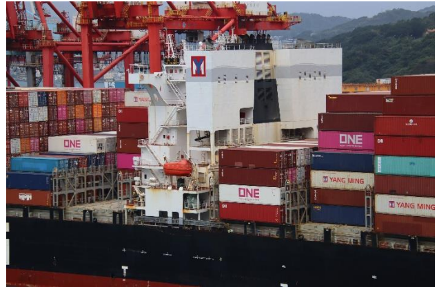
コンテナ船「YM Ubiquity」。煙突の両側にはスクラパーらしき巨大な構造物