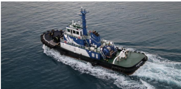
タグボート「ブルースター」