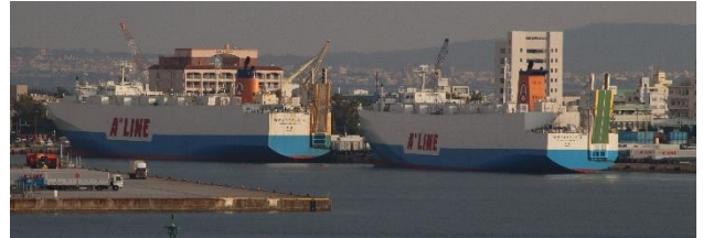
那覇新港に停泊する RORO 貨物船「琉球エクスプレス 6」と「琉球エクスプレス 2」