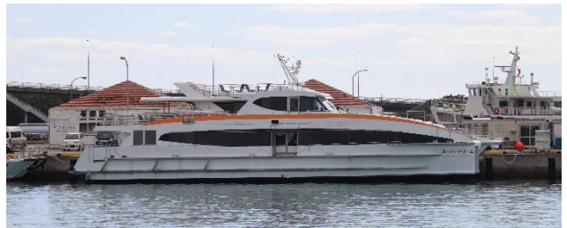
スーパードリーム