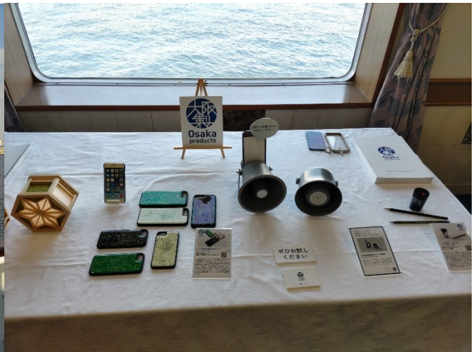
写真6（左上）：船上から眺める神戸空港 航空機の離発着を眺められるよう停止している