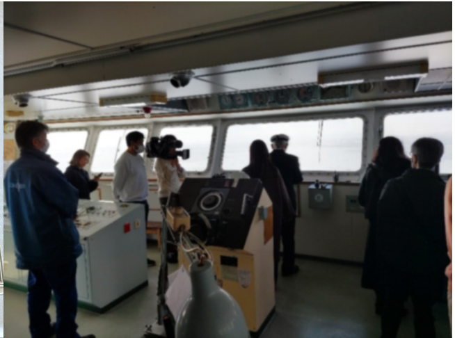
写真5：船内説明会の様子 テレビ局の取材に船長が対応している