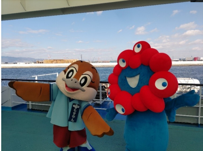
写真3(左下):建設中の万博会場を背景に大阪府広報担当副事もずやんと2025年大阪万博公式キャラクターのミャクミャク