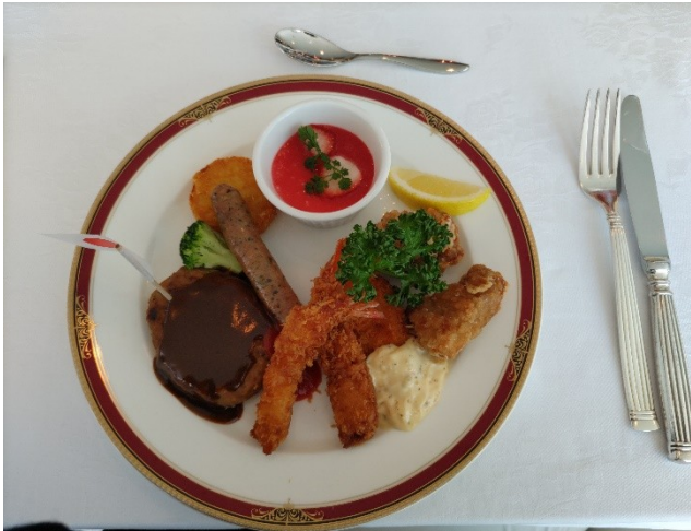
写真4：提供された「大人様ランチ」ソフトドリンクや神戸牛カレーはバイキング方式で提供