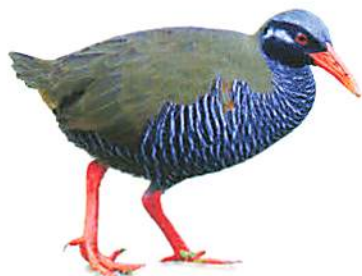
ヤンバルクイナ (イメージ)