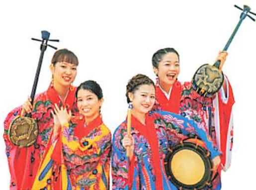
沖縄民謡ユニット「いなぐんぐわ」