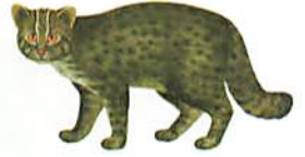
イリオモテヤマネコ (イメージ)