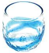
琉球ガラス (イメージ)