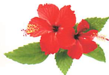
ハイビスカス (イメージ)