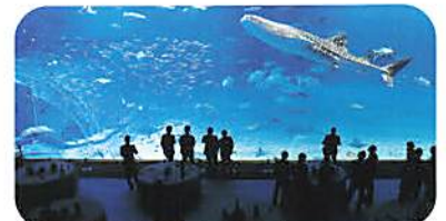
沖縄美ら海水族館「黒潮の海」大水槽前 MICE