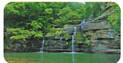
西表島・水落の滝