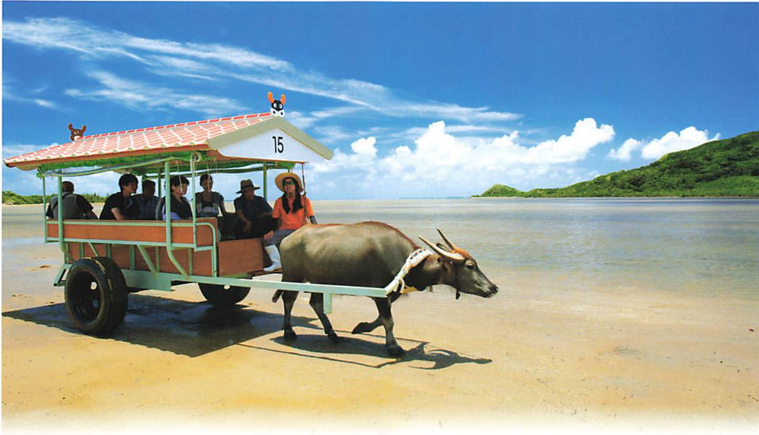
由布島と西表島の間を行き交う水牛車