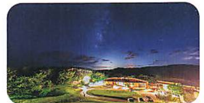
やんばるの森 (イメージ)