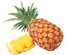
パイナップル (イメージ)