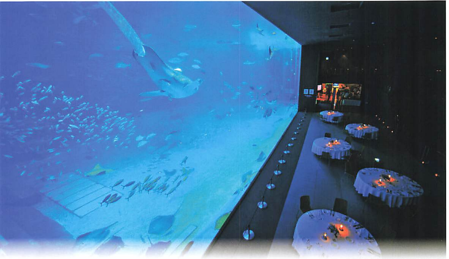
沖縄美ら海水族館「黒潮の海」大水槽前 MICE