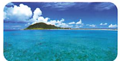
野南大橋からの眺め