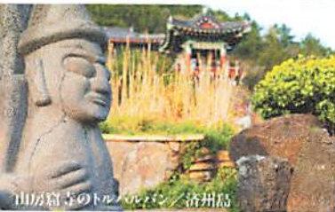
山房窟寺のトル・ハルバン／済州島