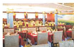
メインダイニング「瑞穂」