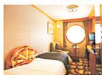
デラックスシングル