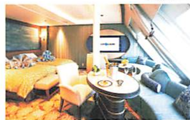
オーシャンビュースイート