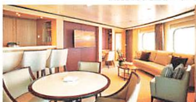
シグネチャースイート