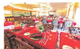
オーシャンドイニング「春田」

お食事はクルーズの醍醐味のひとつ。寄港地や季節ごとの新鮮な食材をシェフが自慢の腕をふるい、目でも楽しめるお料理に仕上げておもてなしします。海の幸から山の幸まで、にっぽん丸こだわりの逸品をお楽しみください。