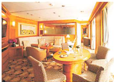
グランドスイート