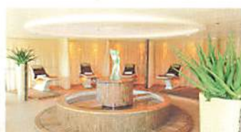
スパ&ウェルネス木霊