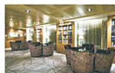
MITSUMI OCEAN スクエア

船内にはプール、スパ、フィットネス施設など多彩にご用意しています。アクティビティやイベントも企画予定ですので、それぞれのライフスタイルに合わせて船内生活をご堪能ください。