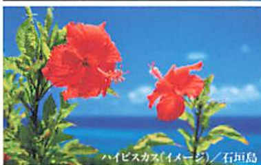
ハイビスカス(イメージ)／石垣島