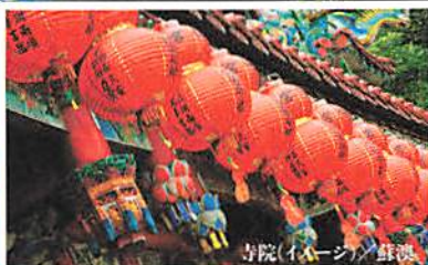
寺院(イメージ)／蘇澳