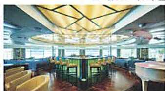
オブザーベーションバー 36 [サンロク]