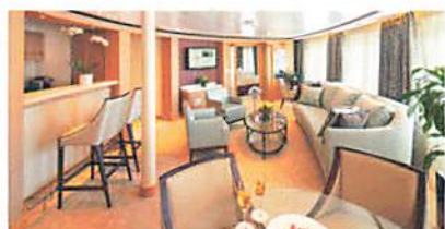
ラグジュアリースイート