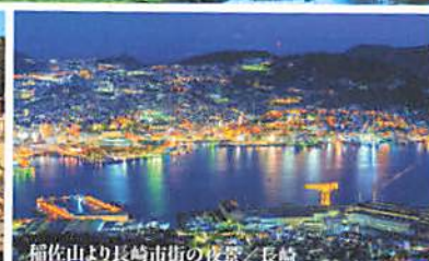
稲佐山より長崎市街の夜景／長崎