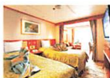
ジュニアスイート