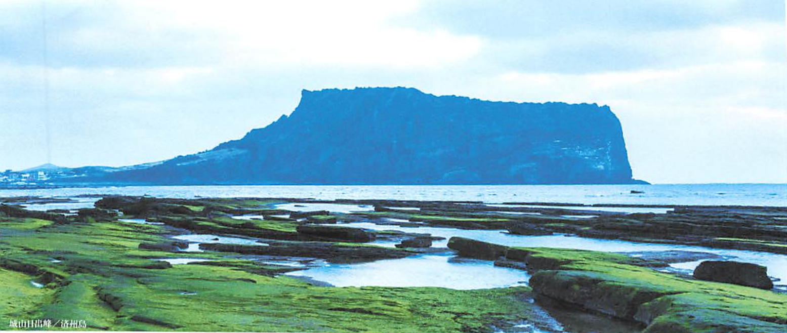
城山日出峰／済州島