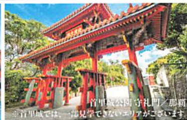
首里城公園 守礼門／那覇 ※首里城では一部見学できないエリアがございます