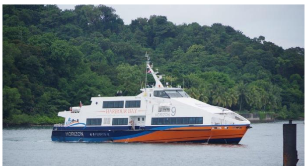
HARBOUR BAY 「HORIZON 9」