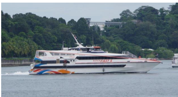
BATAM FAST 「JET RAIDER」