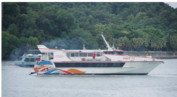
BATAM FAST 「JET FLYTE II」

今回はトランジットなので特に下調べもせずに出かけたが、MRT のハーバー・フロント駅に行けば、ショッピング・センターや以前からのクルーズ・ターミナルがあるし、セントーサ島が目の前なので、何かしらあるのではないかと行ってみた。行ってみると、そこは近郊の島やインドネシア方面への小型船が頻繁に入出港しており、しばらくシップ・ウォッチングをすることになった。また、敷地を隔てる垣根の間から遠くの新クルーズ・ターミナルに「GENTING DREAM」を見ることができ、後で MRT のマリーナ・サウス・ピア駅まで行けば撮影できるのではないと思ったが、ウィークリーで稼働するこの日火曜日は午後 1 時に出港してしまった。