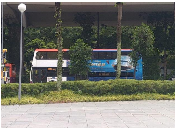
路線バスの車体広告にも