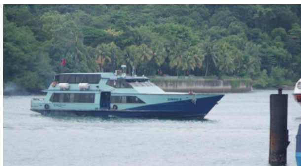
SINDO FERRY 「SINDO 6」