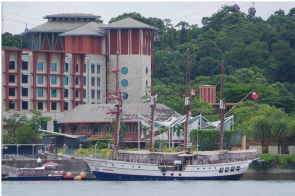
遊覧帆船 「ROYAL ALBATROSS」