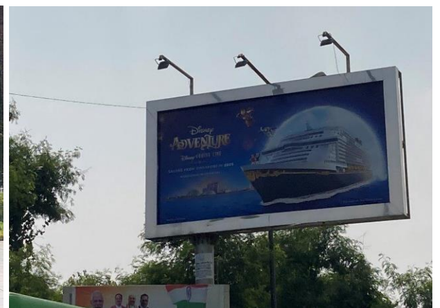
インド・ニューデリーの道路際の大看板