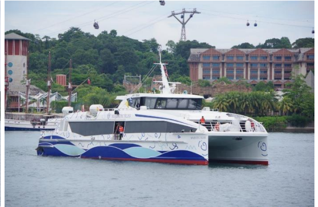
MAJESTIC FAST FERRY 「MAJESTIC BLISS」