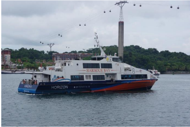
HARBOUR BAY 「HORIZON 8」