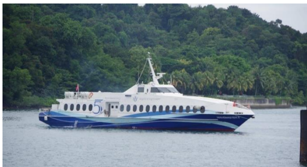
MAJESTIC FAST FERRY 「WAVEMASTER 5」