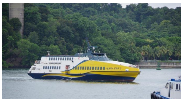
SINDO FERRY 「QUEEN STAR 2」