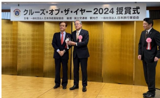
空知信用金庫・旅の力