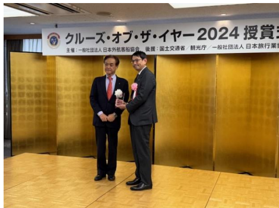
商船三井クルーズ