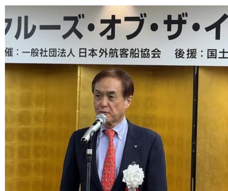
遠藤弘之の会長(郵船クルーズ社長)