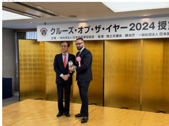
MSC クルーズジャパン