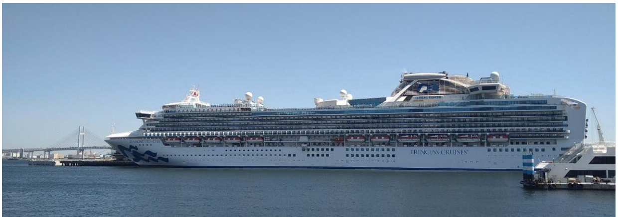
「ダイヤモンド・プリンセス」の船首奥に「クイーン・エリザベス」が見える